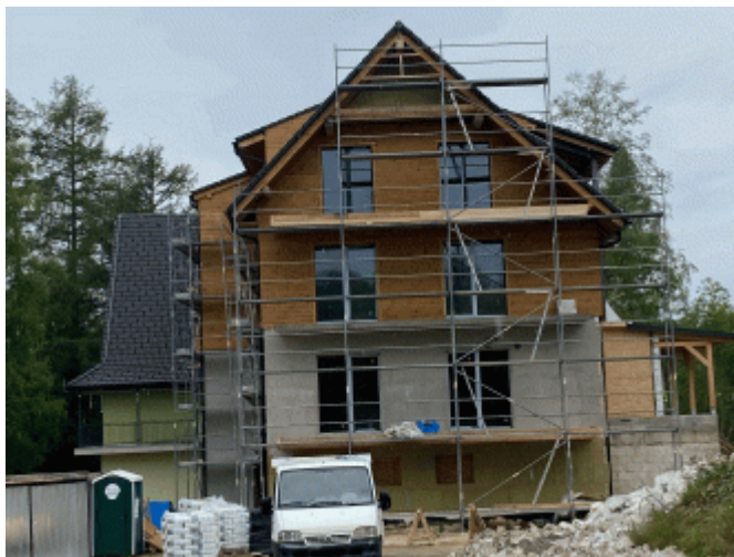
Strana 1 z celkovej strany 4 v prilohe k návrhu